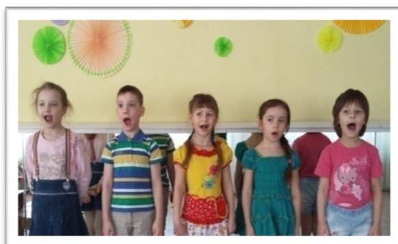
Вокалотерапия в детском саду

Снижение психоэмоционального напряжения педагогов – важная задача в коллективе. Заниматься успокаивающей психотехникой необходимо ежедневно. Уже через несколько дней вы почувствуете себя спокойнее, увереннее, более неуязвимыми для стресса.