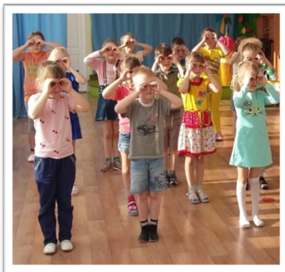
Вокалотерапия на музыкальном занятии

Использование технологии вокалотерапия помогают дошкольнику: снизить уровень легочных и простудных заболеваний; снизить уровень тревожности; способствуют познанию окружающего мира, снижают уровень психоэмоционального и психомышечного напряжения.