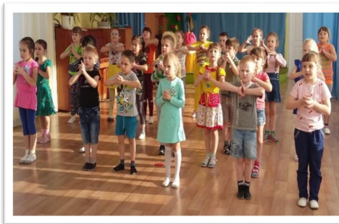
Вокалотерапия в МБДОУ № 279