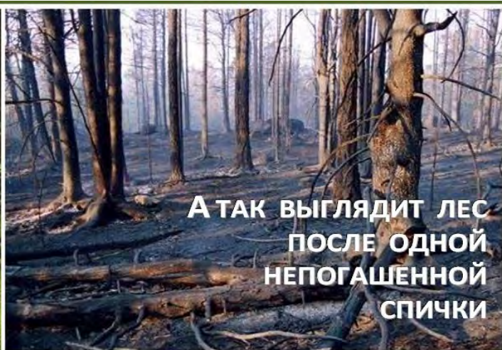
А ТАК ВЫГЛЯДИТ ЛЕС ПОСЛЕ ОДНОЙ НЕПОГАШЕННОЙ СПИЧКИ

СОБЛЮДАЙТЕ ПРАВИЛА ПОЖАРНОЙ БЕЗОПАСНОСТИ В ЛЕСУ